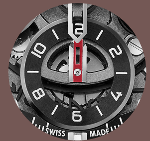
Compteur 12 heures du Chronographe