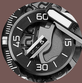
Compteur des secondes de la montre