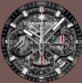
Cadran ajouré avec aiguilles saquelettes lumineuses