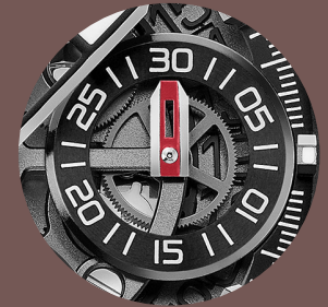
Compteur 30 minutes du Chronographe